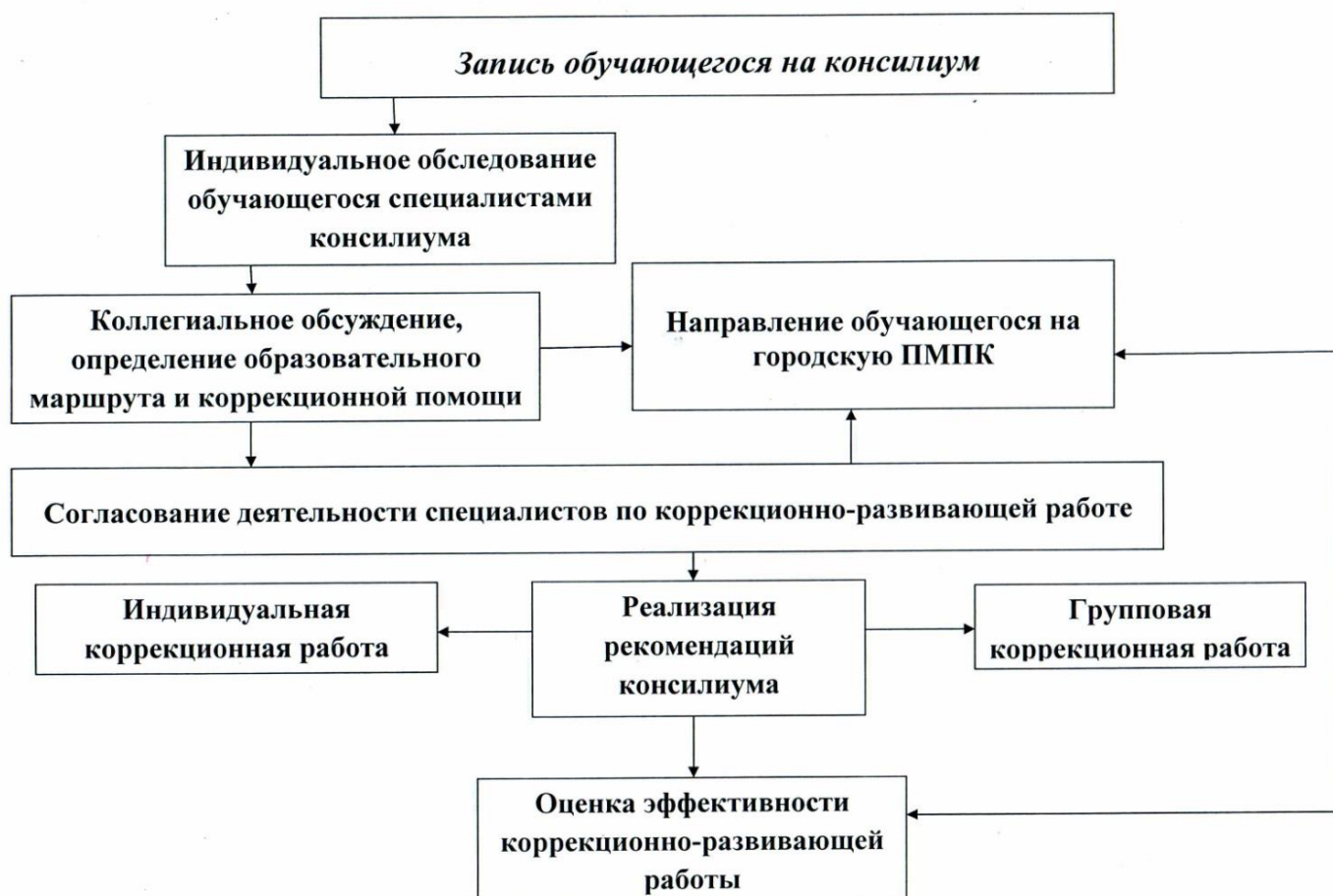
Схема работы школьного психолого-медико-педагогическом консилиума

Для обеспечения эффективной интеграции детей с ограниченными возможностями здоровья в образовательном учреждении проводится информационно-просветительская работа по вопросам, связанным с особенностями образовательного процесса для данной категории детей, со всеми участниками образовательного процесса — обучающимися (как имеющими, так и не имеющими недостатки в развитии), их родителями (законными представителями), педагогическими работниками.